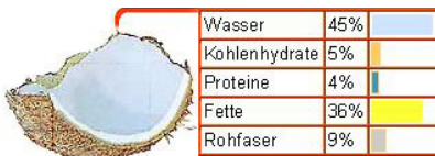
Darstellung: Inhaltsstoffe des Fruchtfleisches der Kokosnuss

Anbei eine kleine Darstellung mit den Inhaltsstoffen im Fruchtfleisch.